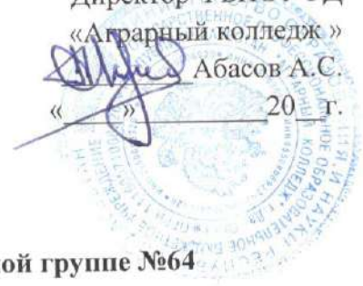
График проведения промежуточной аттестации в учебной группе №64 «Сварщик» За III семестр 2019-2020 уч. года