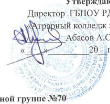
График проведения промежуточной аттестации в учебной группе №70 «Механизация сельского хозяйства» За III семестр 2019-2020 уч. года