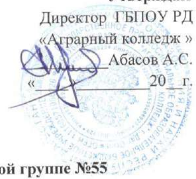
График проведения промежуточной аттестации в учебной группе №55 «Механизация сельского хозяйства» За V семестр 2019-2020 уч. года