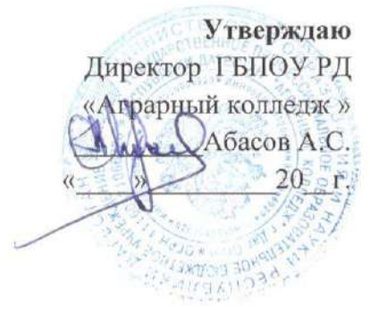
График проведения промежуточной аттестации в учебной группе №63 «Мастер по ремонту и обслуживанию автомобиля» За III семестр 2019-2020 уч. года