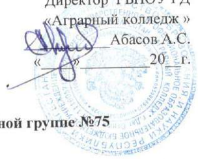
График проведения промежуточной аттестации в учебной группе №75 «Механизация с/х» За I семестр 2019-2020 уч. года