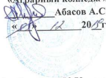
График проведения промежуточной аттестации в учебной группе №53 - 3к «Пожарная безопасность» за V семестр 2018-2019 уч. года