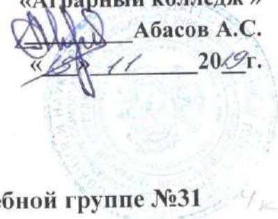
График проведения промежуточной аттестации в учебной группе №31 «Пожарная безопасность» за II семестр 2019-2020 уч. года